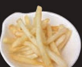
フライドポテト 250円(税込275円)