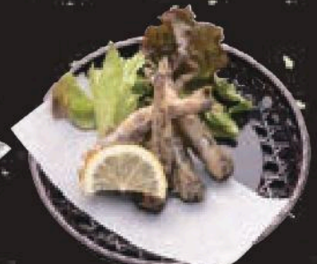
メヒカリ唐揚げ 350円(税込385円)