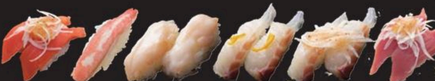
サーモンパッチョ 本ずわい蟹 つぶ貝 真鯛ゆず塩 真鯛パッチョ まぐろパッチョ