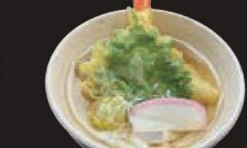
ミニ天ぷらうどん 500円(税込550円)