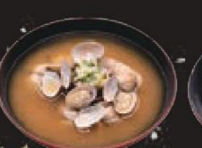
あさり汁 250円(税込275円)