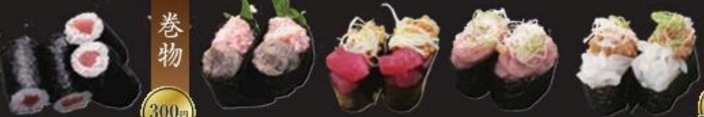
鉄火巻 かに味噌 まぐろ納豆 ねぎとろ軍艦 いか納豆