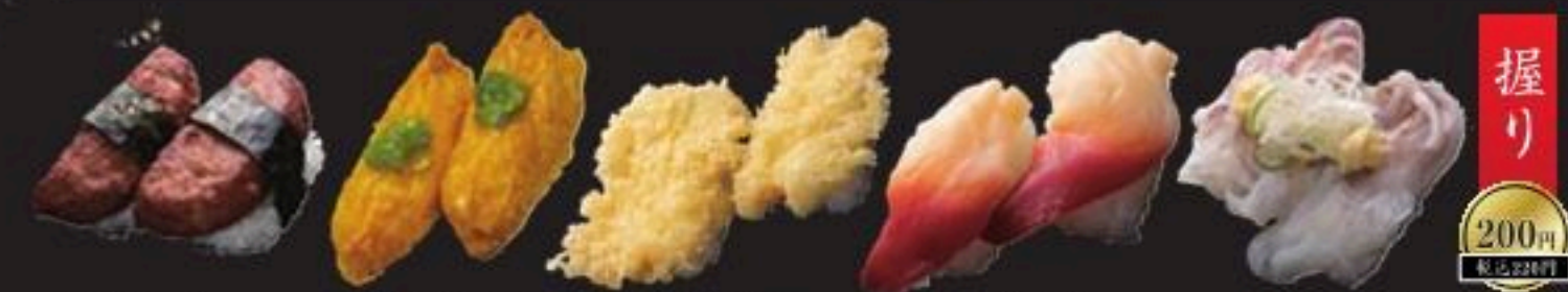
ハンバーグ わさびいなり いか天握り ホッキ貝 生いかげそ