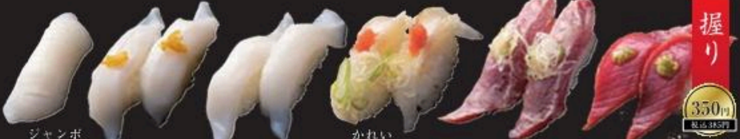
ジャンボ紋甲いか(1貫) 上いかゆず塩 上いか きれいえんがわ炙り まぐろ塩だれ炙り 自家製漬けまぐろ