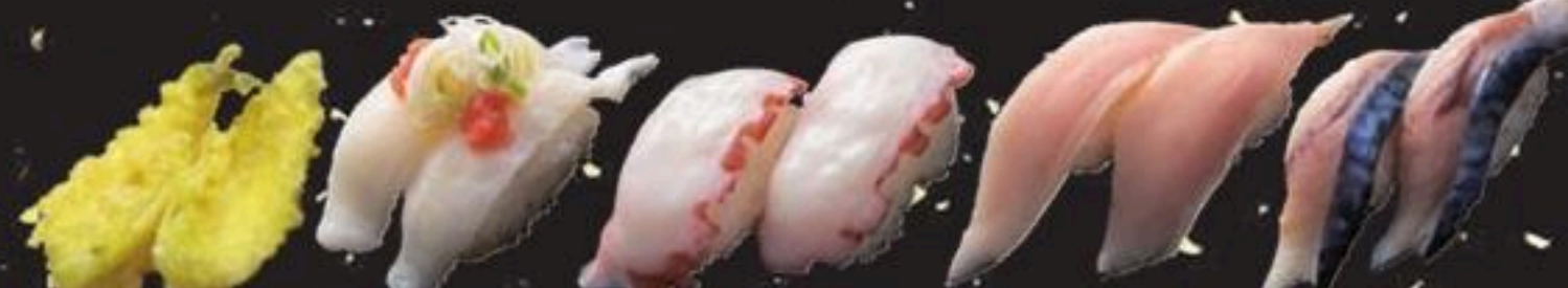
キス天握り きれいえんがわ 真たこ びんちょうまぐろ 自家製しめさば