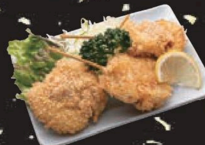
まぐろ串カツ 300円(税込330円)