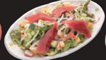
まぐろの カルパッチョ風サラダ 450円(税込495円)