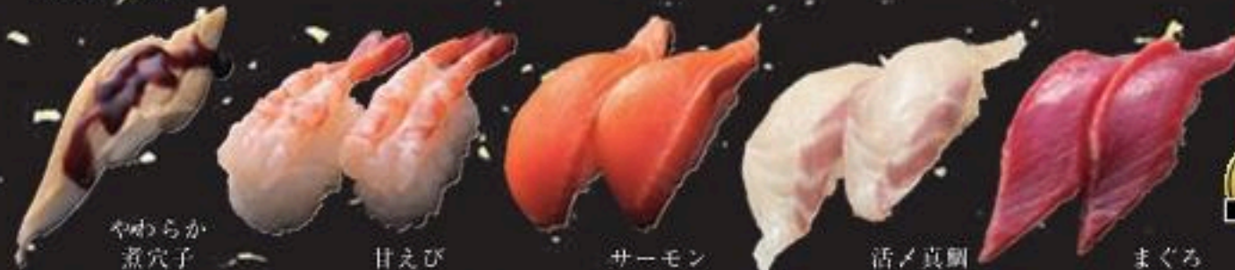
やわらか煮穴子 甘えび サーモン 活ノ真鯛 まぐろ