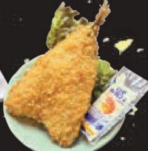
アジフライ 400円(税込440円)