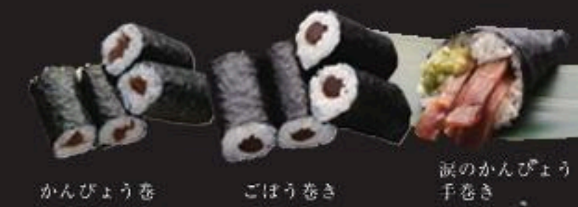
かんぴょう巻 ごほう巻き 涙のかんぴょう手巻き