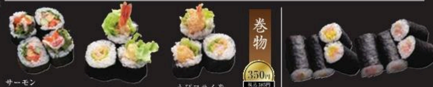
サーモンクリームチーズ巻 えび天巻 えびフライ巻中巻 とろたく巻 ねぎとろ巻