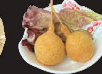
チーズドック 300円(税込330円)