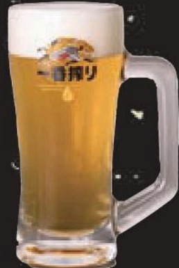
生ビール キリン「一番搾り」 (中ジョッキ) 530円(税込583円)