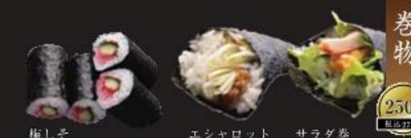
梅しそ かっぱ巻き エシャロット手巻き サラダ巻手巻き