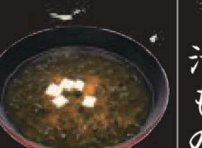
あおさ汁 200円(税込220円)