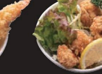
とりの唐揚げ 450円(税込495円)