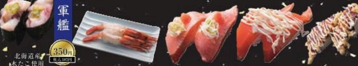
北海道産水たこ使用たこわさび軍艦 天然あかえび サーモン炙り サーモンオニオン まぐろ天握り