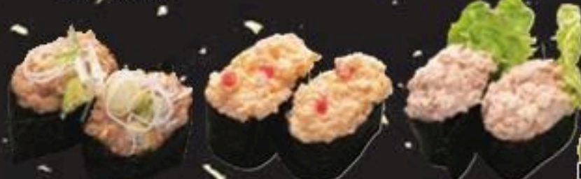
納豆軍艦 王子マヨネーズ ツナサラダ