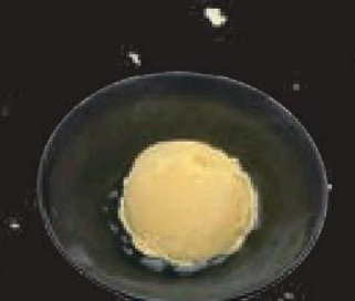
手作り 杏仁豆腐 300円(税込330円)