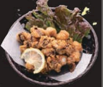
いかげそから揚げ 350円(税込385円)