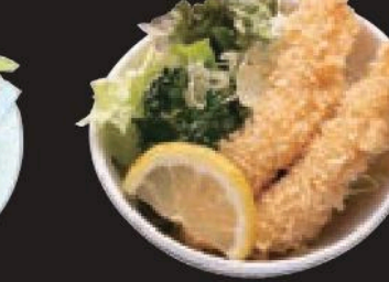
エビフライ 450円(税込495円)