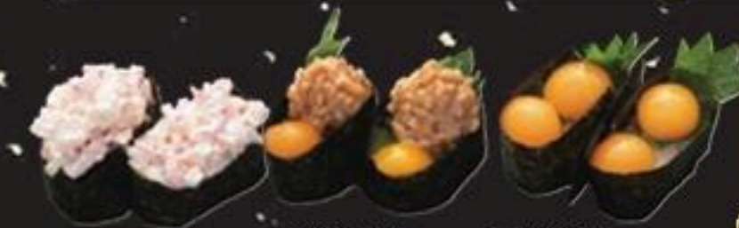
海鮮サラダ うずら納豆 うずら軍艦 ※うずら納豆・うずら軍艦は7月～9月は販売停止。