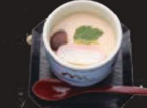
茶碗蒸し 350円(税込385円)