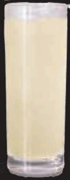
グレープフルーツサワー 480円(税込528円)