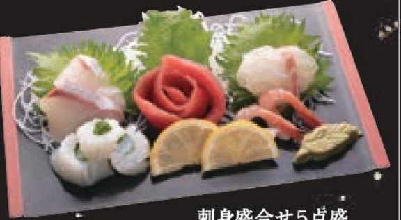
刺身盛合せ5点盛 1000円(税込1100円)