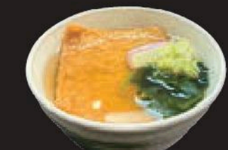
ミニきつねうどん 350円(税込385円)