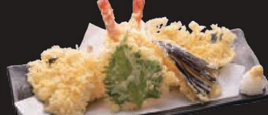
天ぷら盛合せ 950円(税込1045円)