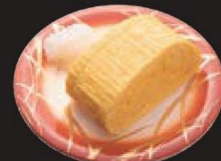
自家製 だし巻き玉子 250円(税込275円)