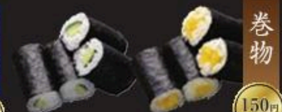
かっぱ巻き おしんこ巻